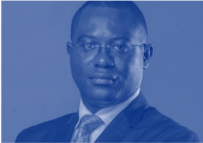
Auteur : Prof. Ribio Nzeza Bunketi Buse